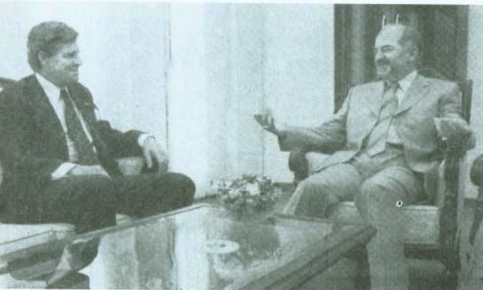
اجتماع مع نائب الرئيس إبراهيم الجعفري، حزيران/يونيو 2004